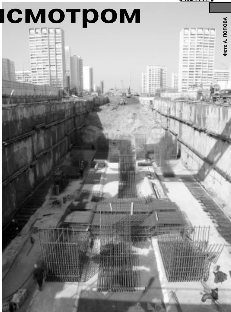
Котлован на Строгинском бульваре продвигается в сторону МКАД.