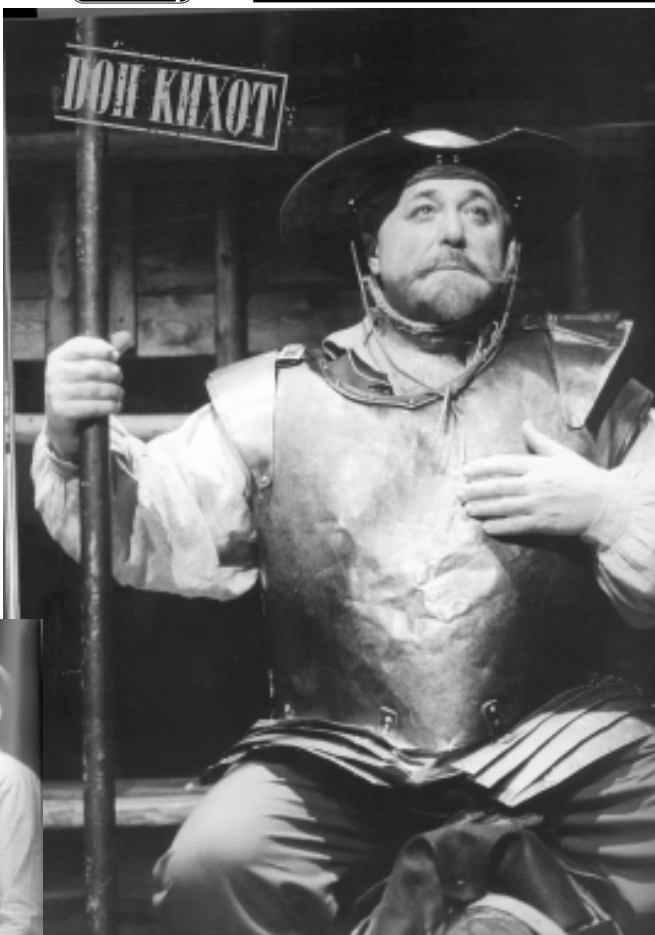
В роли Дон-Кихота в спектакле театра «Et cetera».

Новое здание театра «Et cetera» возведено рядом с метростроевской шахтой № 939.