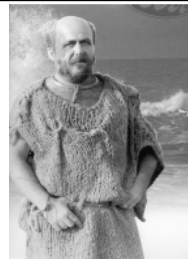
В роли Эзопа в телефильме «Эзоп».

мать о репертуаре, о формировании труппы, своей зрительской аудитории. Я помню, как мы в течение трех лет бомжевали, снимали разные площадки, ютились в каких-то ДК. Потом ценой невероятных усилий нам удалось получить помещение на Новом Арбате. Бывший конференц-зал какого-то министерства мы превратили в театр. У нас был уютный зрительный зал на 400 мест, правда, не было нормального репетиционного помещения, негде было хранить декорации, со служебными помещениями были проблемы, но нам удалось выветрить казенный дух и создать настоящую театральную атмосферу. Я очень рад, что тогда сумел отстоять это помещение, теперь там временно работает Геликон-опера под руководством Дмитрия Бертмана. А мы поселились в новом Доме на Тургеневской площади. Так распорядилась судьба, что возник он неподалеку от тех мест, где бегал я мальчишкой и мечтал о своем театре.