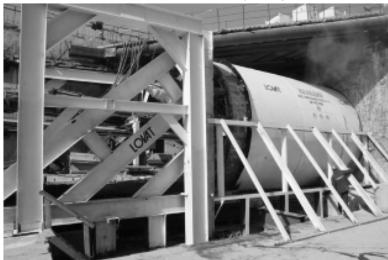
«Ловат» принял старт!