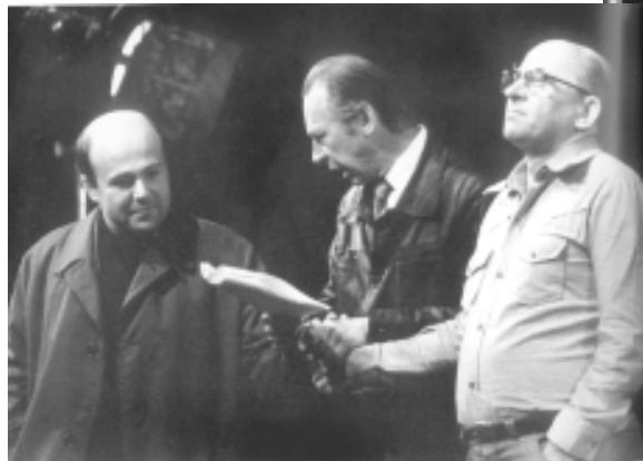
На репетиции «Чайки» с Олегом Ефремовым и Евгением Евстигнеевым. МХАТ им. Горького.

Сегодня народный артист России, дважды лауреат Госпремии СССР, председатель Союза театральных деятелей России, художественный руководитель театра «Et cetera» Александр КАЛЯГИН рассказывает о своем театре и любимых ролях.