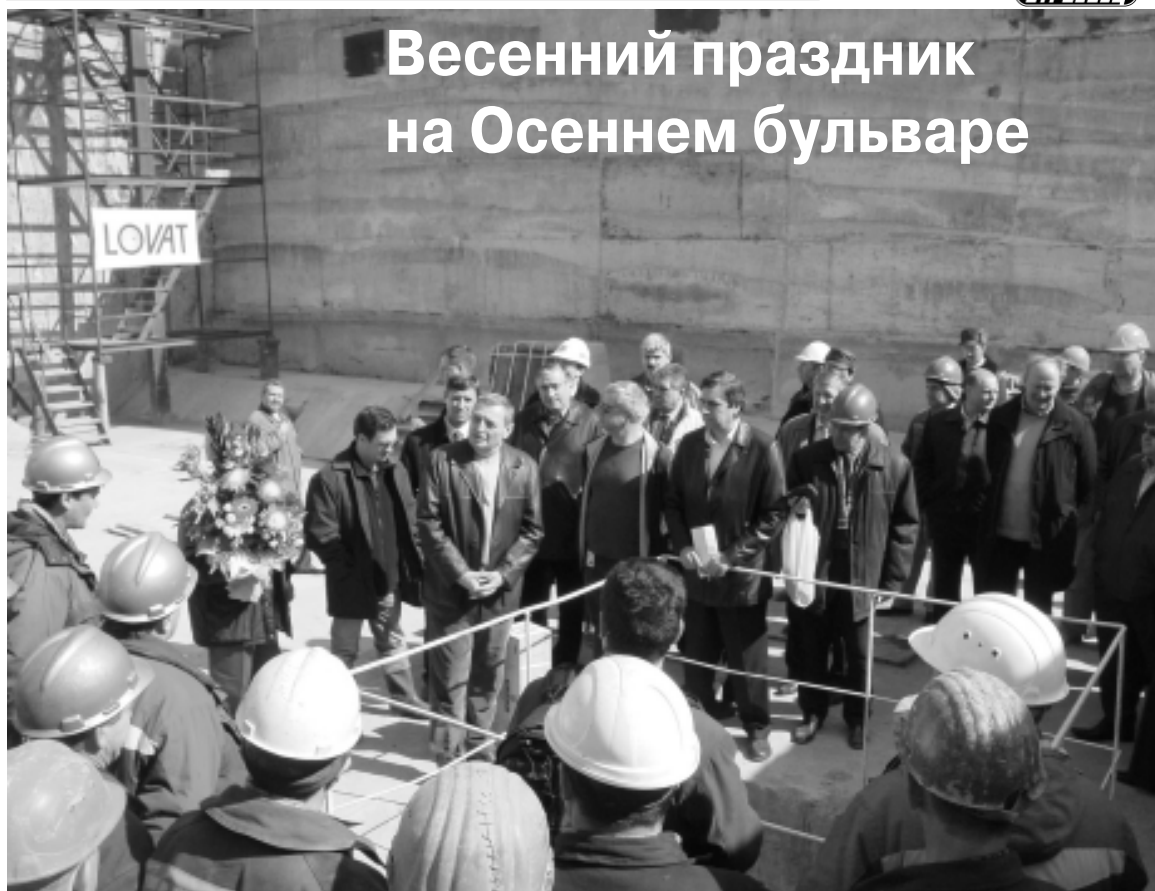
Окончание, начало на стр. 1

тонной крошки, смоченной пенным реагентом. Проходка перегонного тоннеля началась.