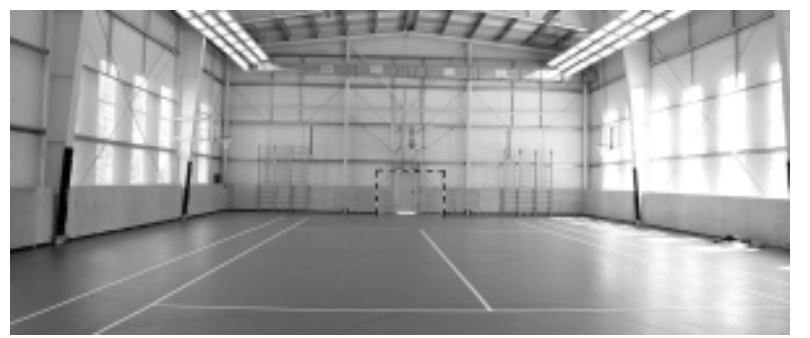
В новом спортзале.

Будущий бар пока напоминает вестибюль станции метро за месяц до пуска — капитальная стена возведена, но нет еще ни пола, ни подвесного потолка. А противополож-