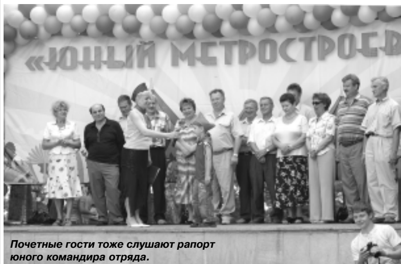
Почетные гости тоже слушают рапорт юного командира отряда.

«Китай-город» сценаристы-постановщики решили отметить песней про «маленькую страну», а вокруг солистки закружился маскарадный хоровод, один из участников которого нарядился в костюм китайского мандарина. Позже один из организаторов сказал, что это было сделано как бы ради шутки, а на самом деле им известно, что название станции никакого отноше-