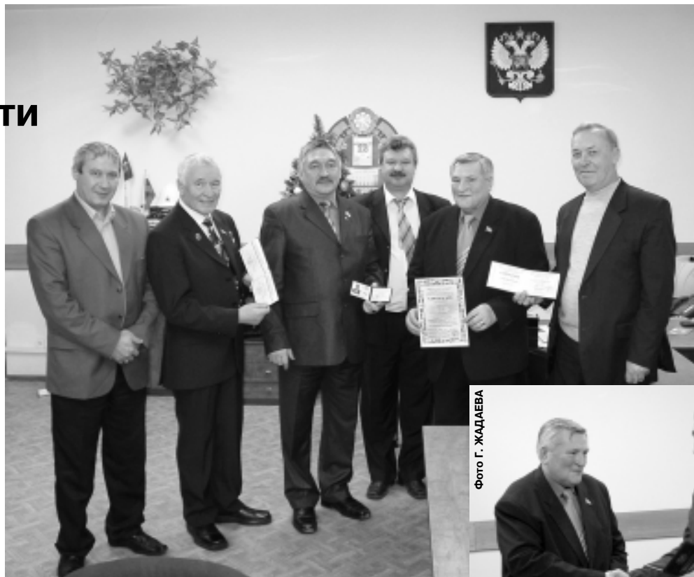
Снимок на память о торжественном дне.