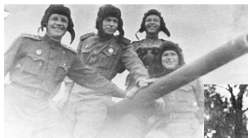
Танкисты 1-го гвардейского танкового Донского корпуса.