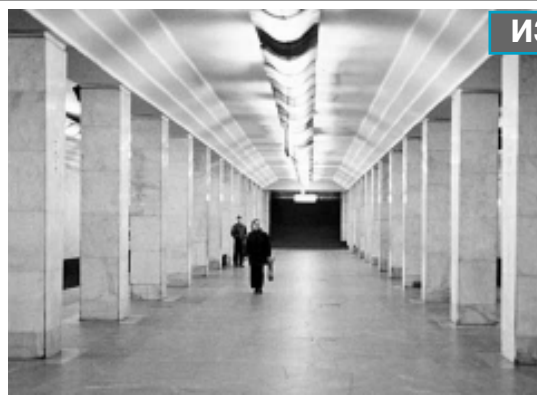
Станция метро «Ленинский проспект». Вход на станцию «Ленинский проспект».

Для выдачи породы от проходки тоннелей и спуска в шахту строительных материалов в левом торце каме-