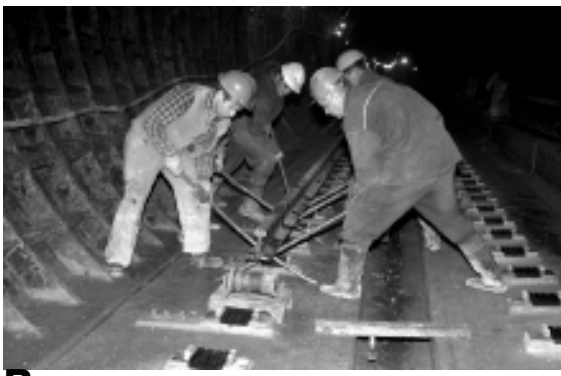
Лом – верный друг путейца.