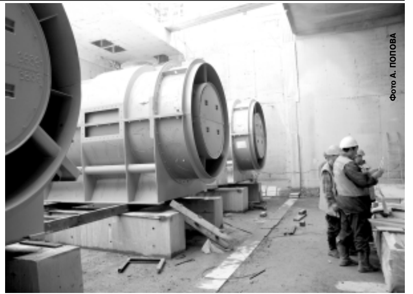
Монтаж вентиляторов на точке «С» Серебряноборского тоннеля ведут специалисты СМУ-4.

На базе этого университета будет также осуществляться дополнительное профессиональное образование специалистов Ростехнадзора по курсам «Промышленная и экологическая безопасность», «Промышленная и пожарная безопасность».