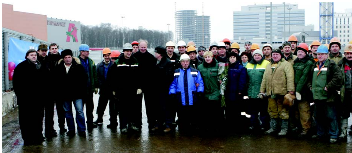
Снимок на память о шестом финише «Ловата».