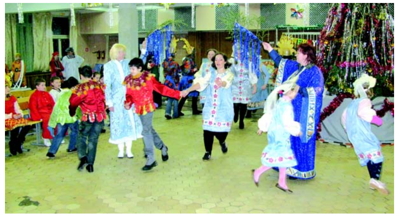
Хоровод у новогодней ёлки.

Какой зимний отдых без лыж и коньков, без санок и горок? Эти каникулы, к счастью, были по-настоящему зимними, без капелей и зеленой травы. И потому ребята активно выходили на лыжню. С удовольствием лепили снежки. Не пустовал и спортивный зал, детвора от души гоняла по полю футбольный мяч и играла в пионербол. А