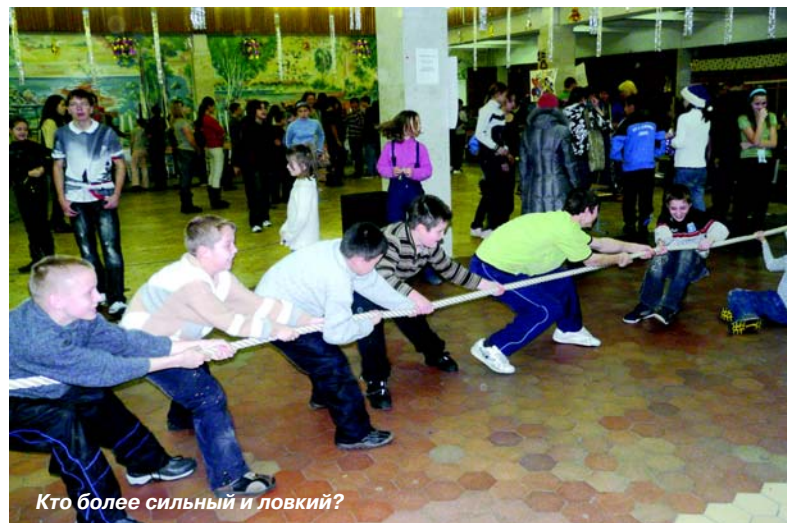
Кто более сильный и ловкий?

Новый день нового года, 1 января, отдыхающие отпраздновали