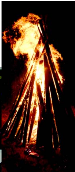
Рождественский костер, в который ребята бросали записки с желаниями.