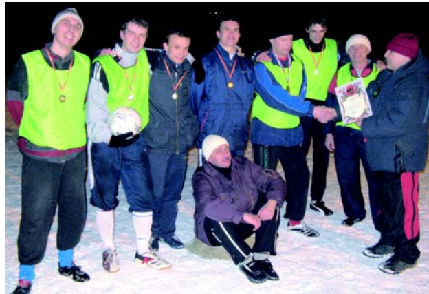
Команда СМУ-3, занявшая третье место.