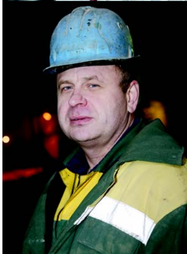
До портала — 30 метров.