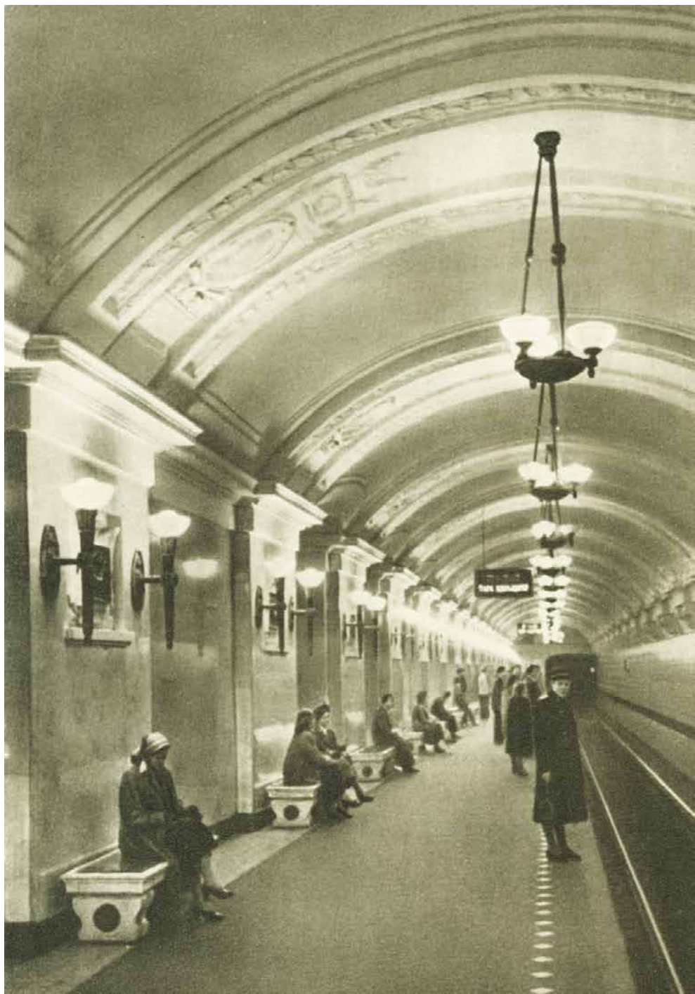
Посадочная платформа станции «Октябрьская»–кольцевая (1953 год)