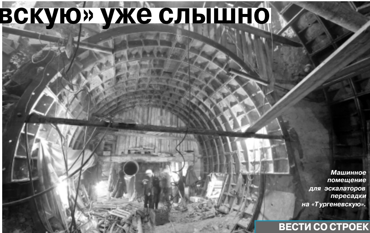
Машинное помещение для эскалаторов пересадки на «Тургеневскую».