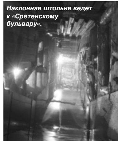
Наклонная штольня ведет к «Сретенскому бульвару».