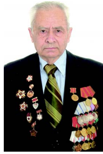
Парадный портрет ветерана накануне 60-летия Победы.

роны. А всё остальное время – это подземка, проходка перегонных тоннелей и возведение станций, в том числе в составе того же Тоннельного отряда.