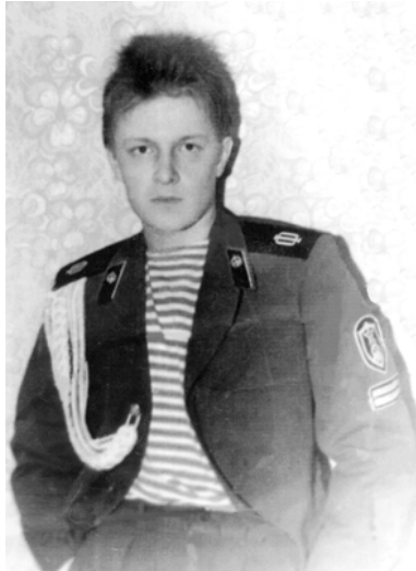
«Мне форма воина к лицу».

автослесаря и водителя. Технар. И вместе с тем... Преподаватели-гуманитарии чувствовали: он их, этот романтически настроенный красивый, умный мальчик. Писал стихи, играл на гитаре, мечтал об увлекательных путешествиях: «Вот вернусь из армии, и уеду в Певек», а это — самый северный город России.