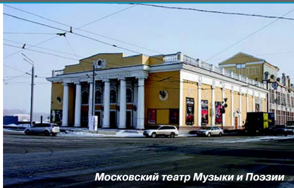
Московский театр Музыки и Поэзии